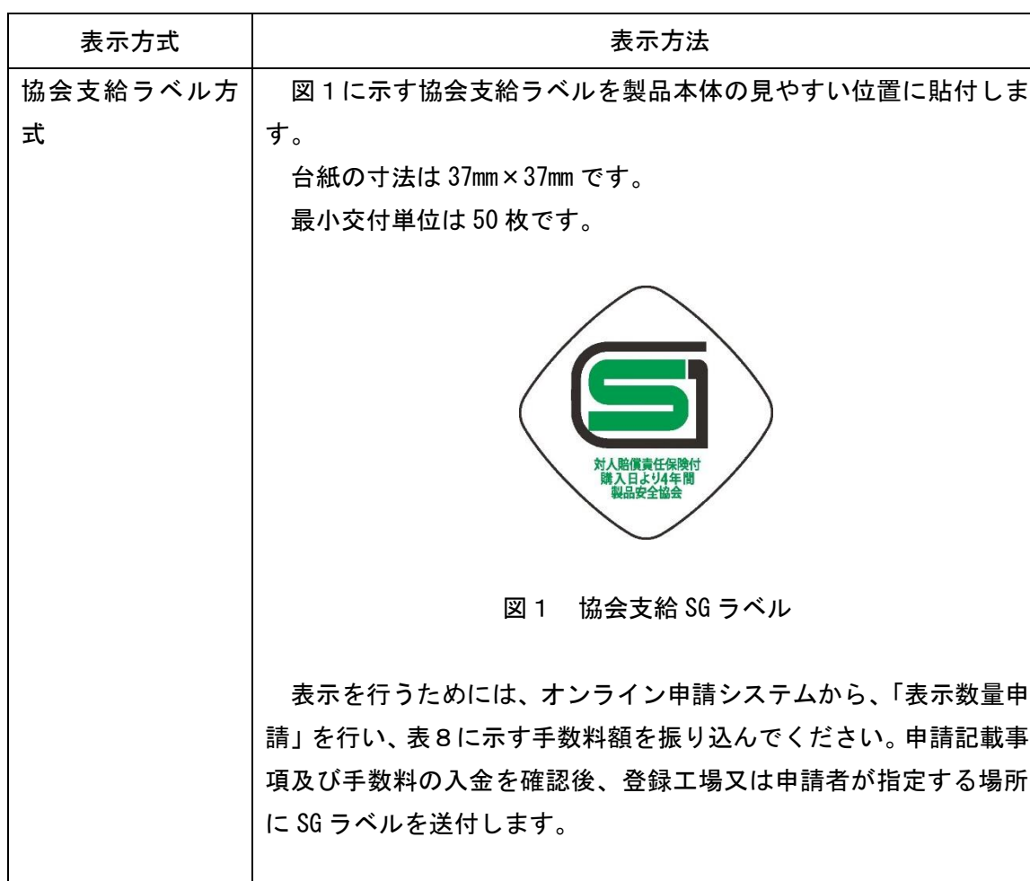
表 7 : 工場登録・型式確認の SG マーク表示方法