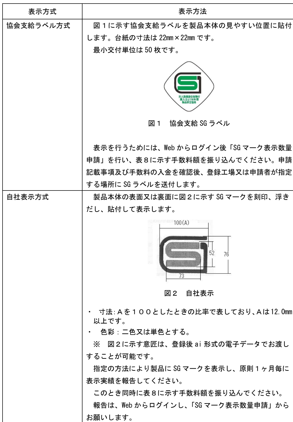
表7：工場登録・型式確認のSGマーク表示方法