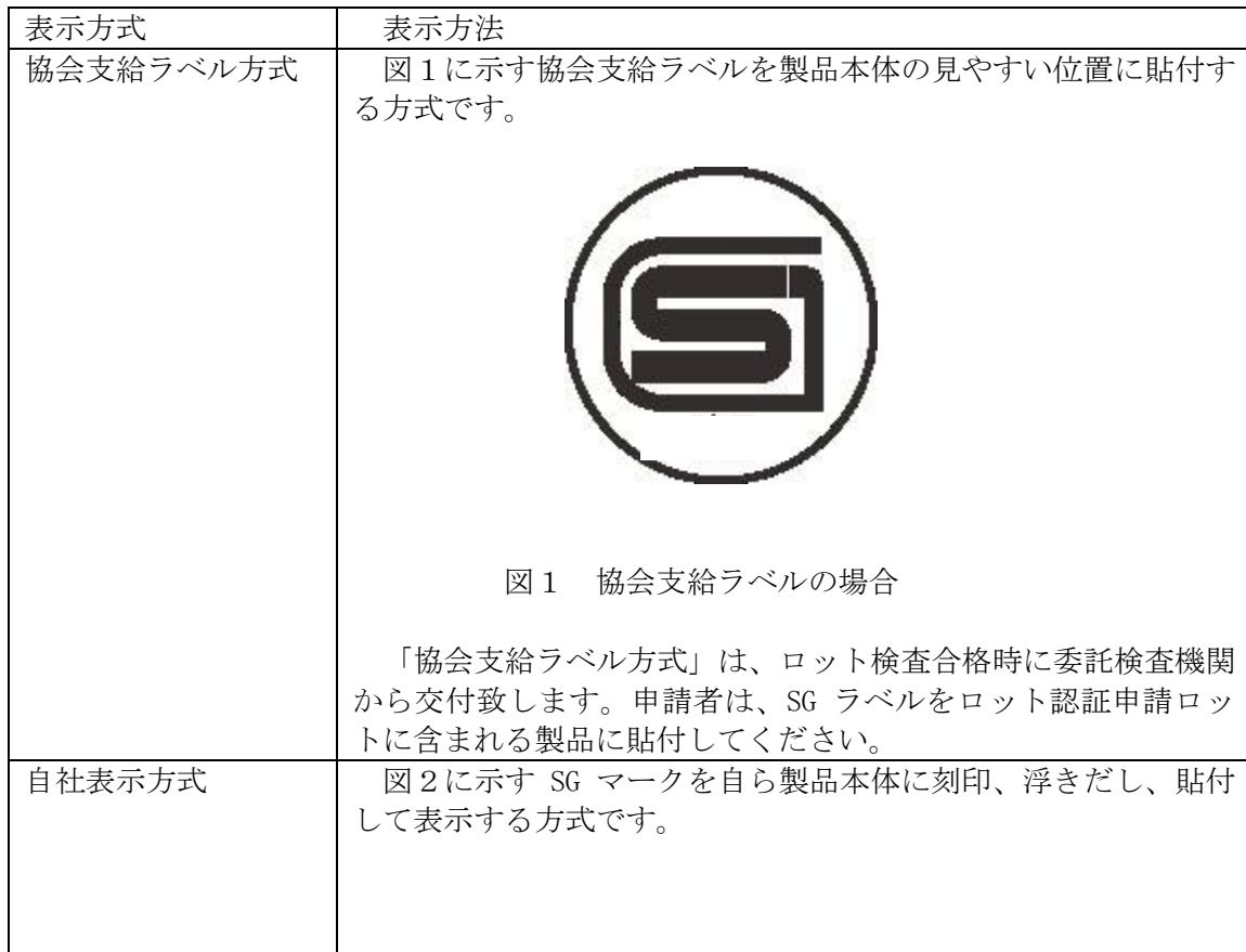
表 7 : 工場登録・型式確認の SG マーク表示方法